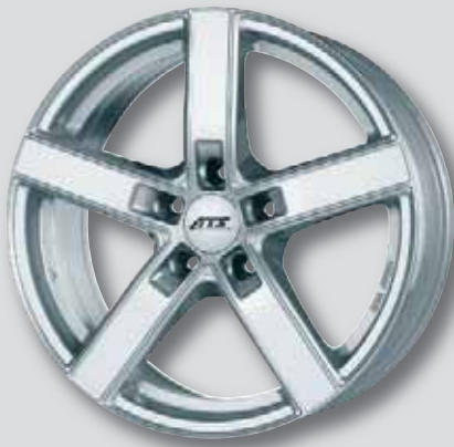
ATS Emotion silber lackiert