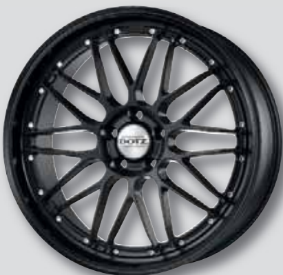
Dotz Revvo black edt. schwarz matt lackiert

7,5 x 17 8,5 x 19 8,0 x 18 9,5 x 19 8,0 x 19 8,5 x 20 9,5 x 20