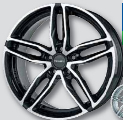
Carmani 13 Twinmax schwarz Front poliert