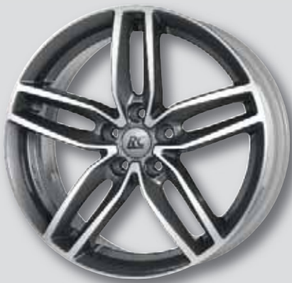
RC 29 anthrazit Front poliert