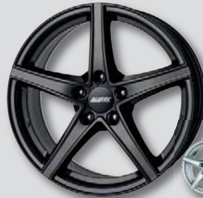
Alutec Raptr schwarz matt lackiert

6,5 x 16 7,5 x 18 6,5 x 17 8,0 x 18 7,5 x 17 8,0 x 19 8,5 x 20