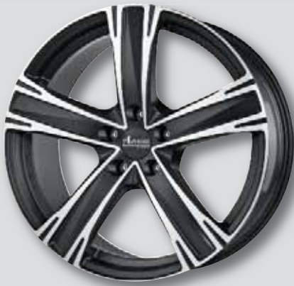
Advanti Raccoon black schw. matt Front poliert

7,5 x 17 9,0 x 20 8,0 x 18 9,0 x 21 8,5 x 19 10,0 x 21