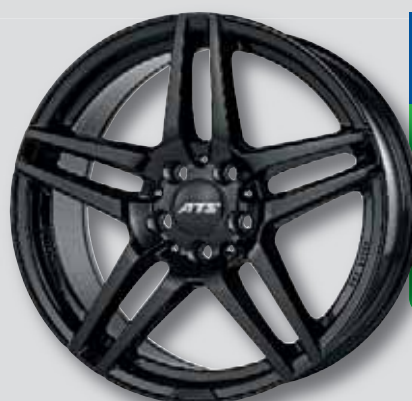
ATS Mizar schwarz lackiert

6,5 x 16 8,5 x 18 7,5 x 16 8,0 x 19 7,0 x 17 8,5 x 19 7,5 x 17 8,5 x 20 8,0 x 17 9,0 x 21 8,0 x 18 10,0 x 21