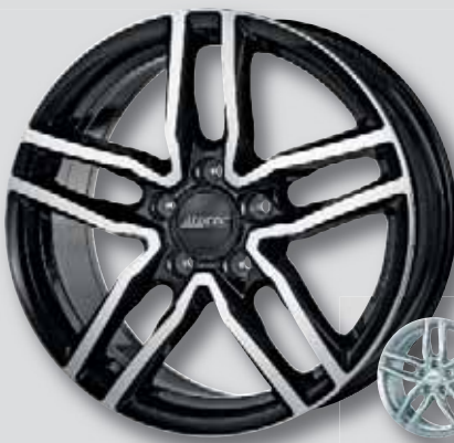
Alutec Ikenu schwarz Front poliert

6,5 x 16 8,0 x 18 6,5 x 17 8,0 x 19 7,5 x 17 8,5 x 20