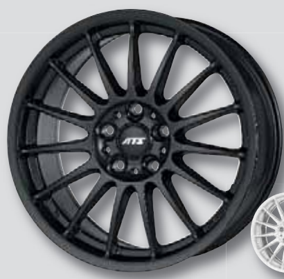
ATS Streetrallye schwarz matt lackiert