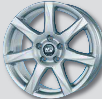
MSW 77 silber lackiert

5,0 x 14 7,5 x 17 6,0 x 15 8,0 x 18 7,0 x 16