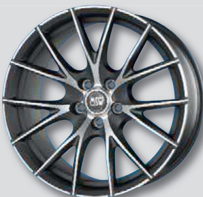
MSW 25 antr. matt Front poliert

6,0 x 15 8,0 x 18 7,0 x 16 8,5 x 18 7,0 x 17 9,0 x 18 7,5 x 17 8,0 x 19 8,0 x 17 9,0 x 19