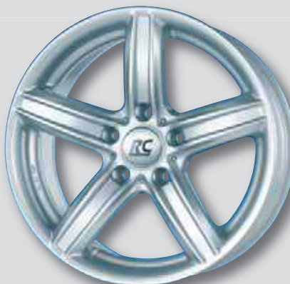
RC 21 silber lackiert

auch in anthrazit Front poliert und schwarz matt lackiert