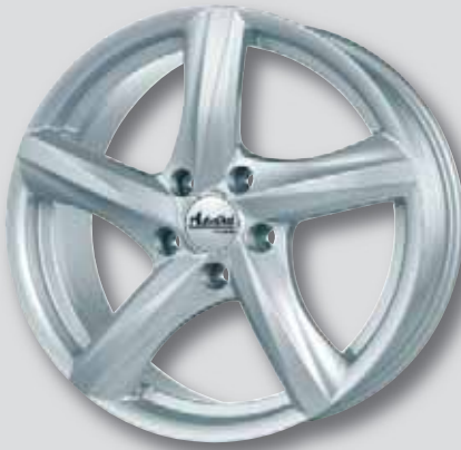
Advanti Nepa silber lackiert