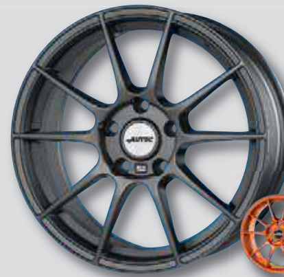
Autec Wizard anthrazit matt lackiert

6,5 x 15 7,5 x 17 7,0 x 16 8,0 x 18 8,0 x 19