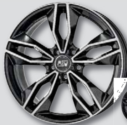
MSW 71 anthrazit Front poliert