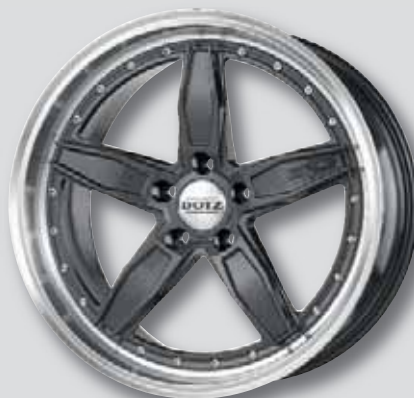
Dotz SP5 dark anthrazit Horn poliert