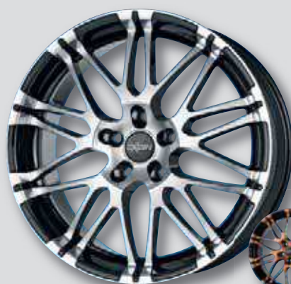
Oxigin 14 Oxrock schwarz Front poliert

wintertauglich ❄️ auch mit Klebefolienveredelung