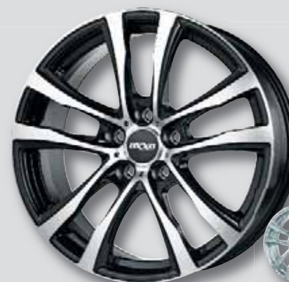
OXXO Decimus black schwarz Front poliert