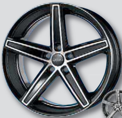
Oxigin 18 Concave schwarz Front poliert