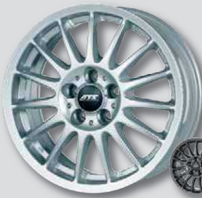
ATS Streetrallye silber lackiert