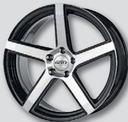
Dotz CP5 dark schwarz Front poliert