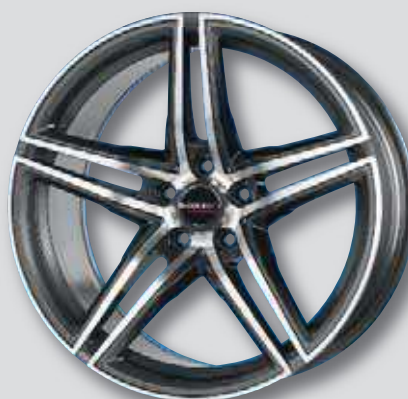
Borbet XRT anthrazit Front poliert

8,0 x 17 8,5 x 19 8,0 x 18 9,5 x 19 9,0 x 18 8,5 x 20 9,5 x 20