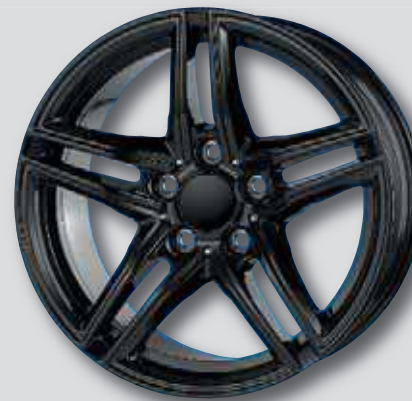
Borbet XR schwarz lackiert

6,5 x 16 7,5 x 17 7,0 x 16 8,0 x 17 7,5 x 16 8,0 x 18