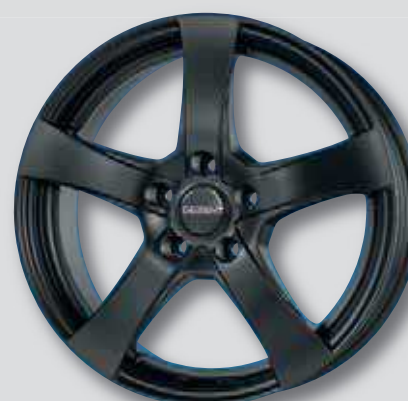
Dezent RE dark schwarz matt lackiert