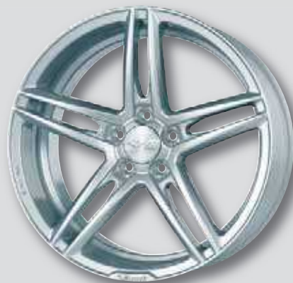
Brock B33 silber lackiert