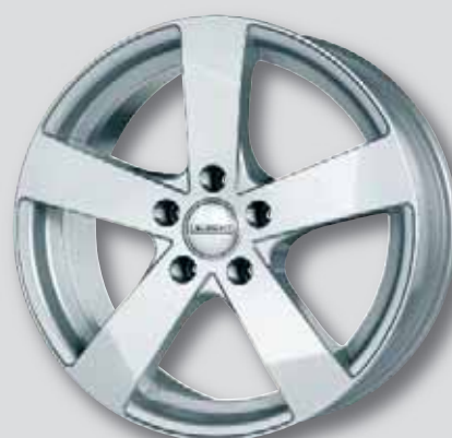
Dezent TD silber lackiert