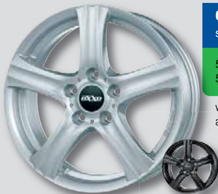
OXXO Charon silber lackiert