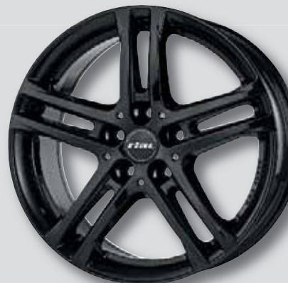
Rial Bavaro schwarz lackiert