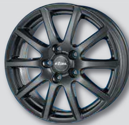
Rial Milano anthrazit lackiert

5,5 x 14 6,5 x 16 6,0 x 15 7,0 x 17 6,5 x 15 7,5 x 18