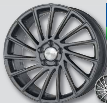
Brock B39 anthrazit matt lackiert