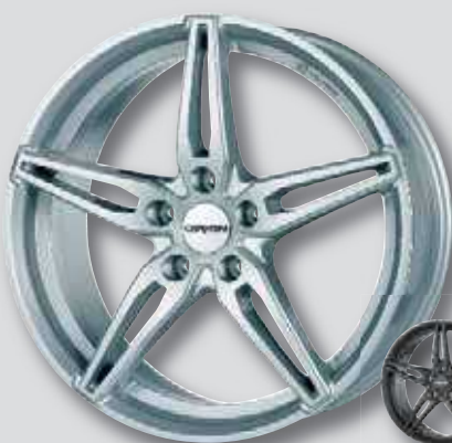
Carmani 15 Oskar silber lackiert

6,5 x 16 8,5 x 18 7,0 x 17 8,5 x 19 7,5 x 18 9,0 x 20