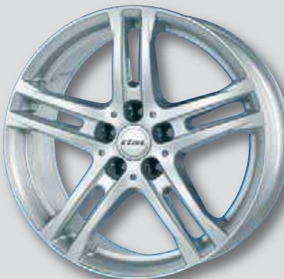
Rial Bavaro silber lackiert