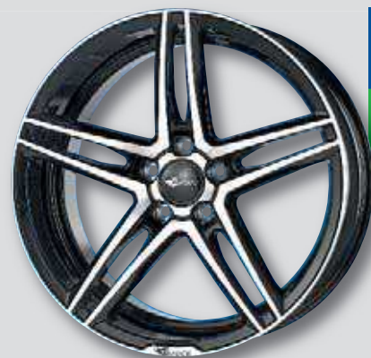
Brock B33 schwarz Front poliert