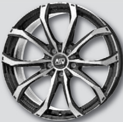
MSW 48 schwarz Front poliert

6,5 x 16 8,5 x 20 7,5 x 17 9,5 x 20 8,0 x 18 9,0 x 21 8,0 x 19 9,5 x 21 9,0 x 19 10,0 x 21 6,5 x 20 11,5 x 21