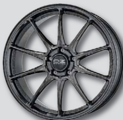
O.Z. Hyper GT HLT anthrazit lackiert