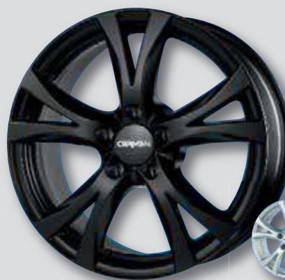
Carmani 9 Compete schwarz matt lackiert

6,5 x 15 7,5 x 17 6,5 x 16 8,0 x 17 7,0 x 16 8,0 x 18