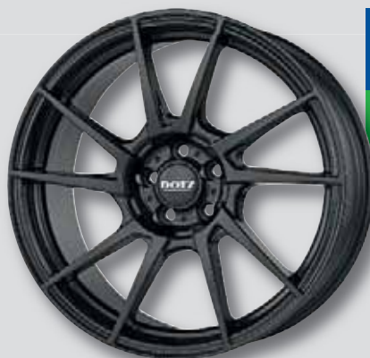
Dotz Kendo dark schwarz matt lackiert