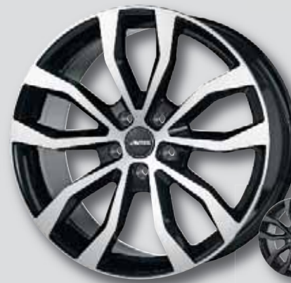
Autec Uteca schwarz Front poliert

7,5 x 17 9,0 x 20 8,0 x 18 9,0 x 21 8,5 x 19