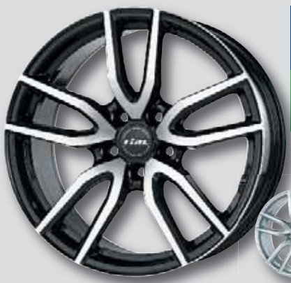
Rial Torino schwarz Front poliert