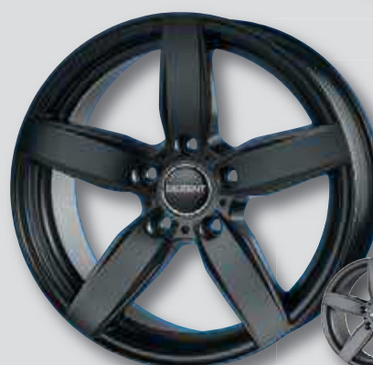
Dezent TB dark schwarz matt lackiert