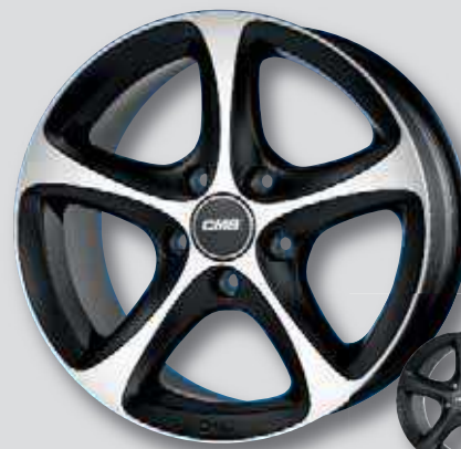
CMS C12 schw. matt Front poliert