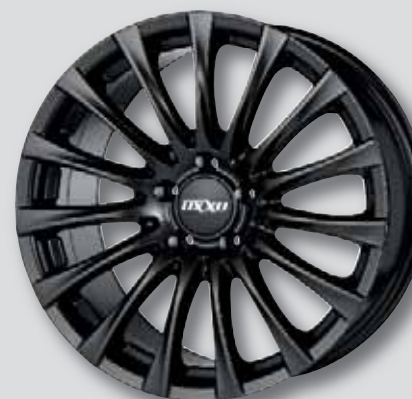
OXXO Elan black schwarz lackiert

6,5 x 16 7,5 x 18 7,0 x 16 8,0 x 18 6,5 x 17 8,5 x 18 7,0 x 17 8,0 x 19 7,5 x 17