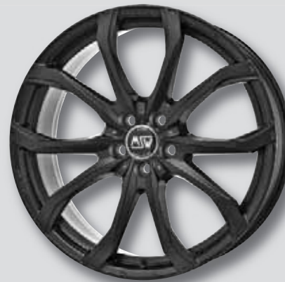
MSW 48 schwarz matt lackiert

6,5 x 16 8,5 x 20 7,5 x 17 9,5 x 20 8,0 x 18 9,0 x 21 8,0 x 19 9,5 x 21 9,0 x 19 10,0 x 21 6,5 x 20 11,5 x 21