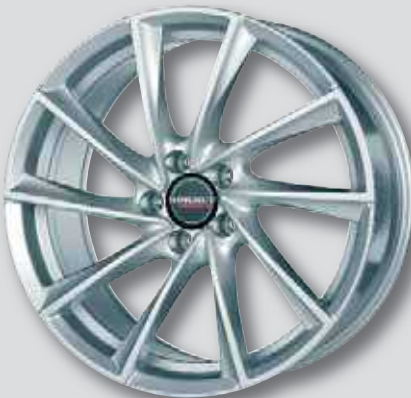
Borbet VTX silber lackiert

8,0 x 18 8,5 x 19 7,5 x 19 9,5 x 19 6,5 x 20