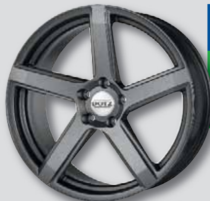
Dotz CP5 anthrazit matt lackiert