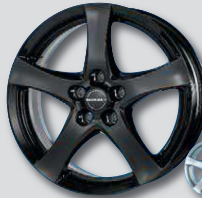
Borbet F schwarz lackiert

6,0 x 15 7,0 x 17 6,0 x 16 8,0 x 18 6,5 x 16