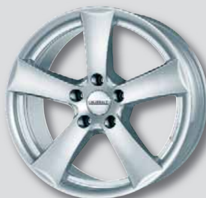
Dezent TX silber lackiert