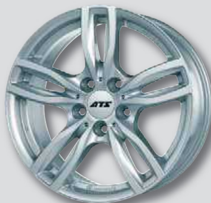
ATS Evolution silber lackiert

7,0 x 16 7,0 x 18 7,5 x 17 8,0 x 18 8,0 x 17 9,0 x 19