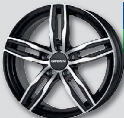
Carmani 14 Paul schwarz Front poliert