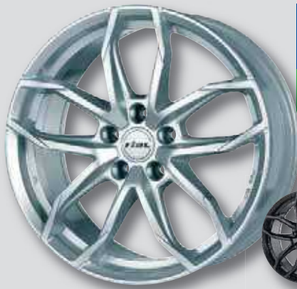
Rial Lucca silber lackiert

6,5 x 16 8,0 x 18 6,5 x 17 8,0 x 19 7,5 x 17 8,0 x 20