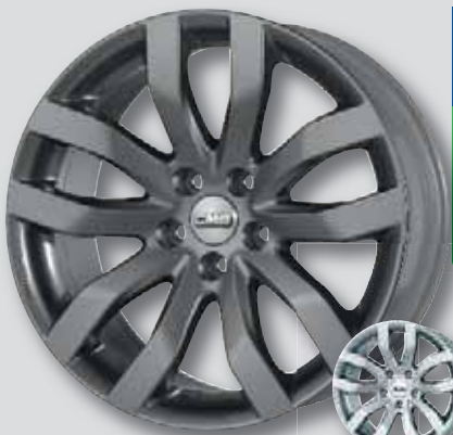
CMS C22 anthrazit lackiert