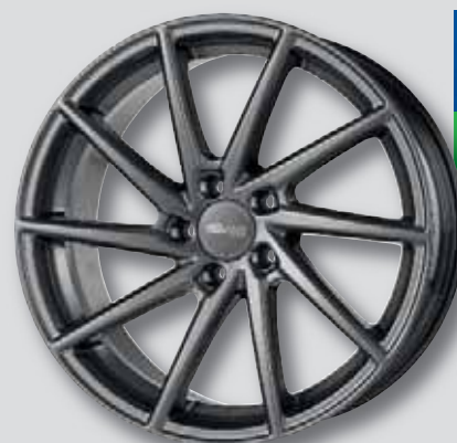
Brock B37 dark sparkle