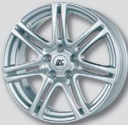
RC 28 silber lackiert