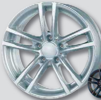
Rial X10 / X10X silber lackiert