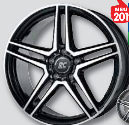
NEU 2019 RC D17 schwarz Front poliert

6,5 x 16 7,5 x 17 6,5 x 17 8,0 x 18 7,0 x 17 8,5 x 19