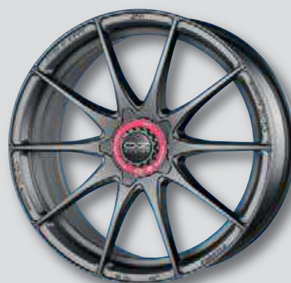
O.Z. Formula HLT anthrazit matt lackiert

wintertauglich * auch in anthrazit matt Front poliert Flowforming