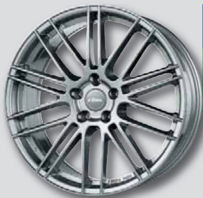
Rial Kibo / Kibo X metal-grey

7,5 x 17 8,5 x 20 8,0 x 18 9,0 x 20 8,0 x 19 9,5 x 21