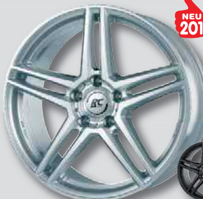
NEU 2019 RC D17 silber lackiert

6,5 x 16 7,5 x 17 6,5 x 17 8,0 x 18 7,0 x 17 8,5 x 19