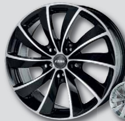
Rial Lugano schwarz Front poliert

6,5 x 16* 8,0 x 18 7,5 x 16 8,5 x 19 7,5 x 17