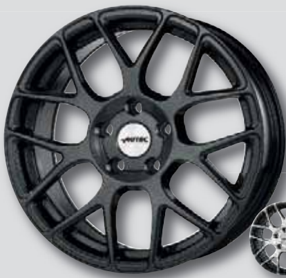
Autec Hexano schwarz metallic