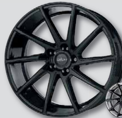
Oxigin 20 Attraction schwarz lackiert

Weitere Farbvarianten auf Anfrage möglich!