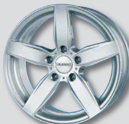
Dezent TB silber lackiert