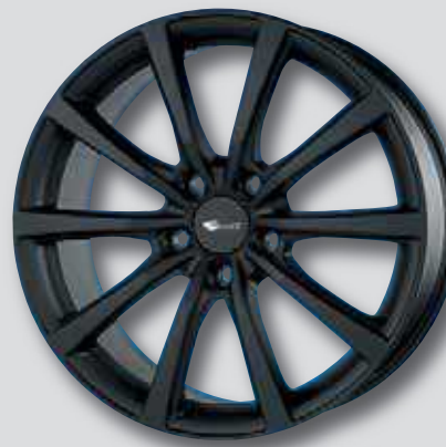
Brock B32 schwarz matt lackiert

7,5 x 18 8,5 x 20 8,5 x 18 9,5 x 20 7,5 x 19 10,5 x 20 8,5 x 19 11,0 x 20 9,5 x 19 9,0 x 21 11,0 x 19 10,0 x 22 11,0 x 22