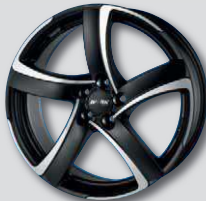
Alutec Shark schw. matt Front poliert

6,0 x 15 7,0 x 17 6,0 x 16 7,5 x 17 7,0 x 16 8,0 x 18