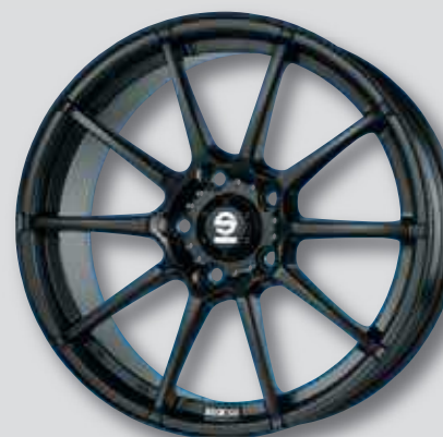
Sparco Assetto Gara schwarz matt lackiert

teilweise auch in anthrazit matt lackiert und schwarz Front poliert