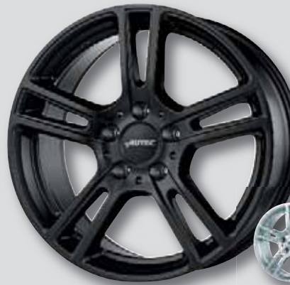
Autec Mugano schwarz matt lackiert