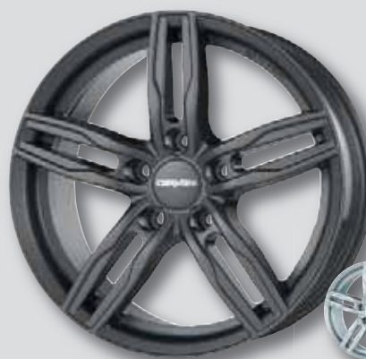
Carmani 14 Paul hypergun