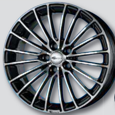
Brock B24 schwarz Front poliert

7,0 x 16 7,5 x 17 7,5 x 16 8,0 x 18 7,0 x 17 8,0 x 19