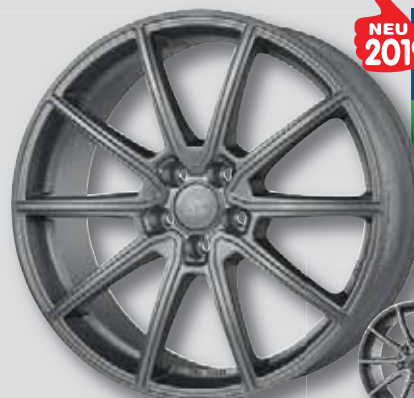
NEU 2019 RC 32 ferric grey