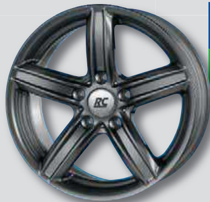
RC 21 anthrazit lackiert