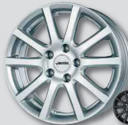
Autec Skandic silber lackiert