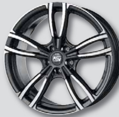
MSW 73 anthrazit Front poliert

7,5 x 17 8,0 x 19 8,0 x 18 8,5 x 19 8,5 x 18 9,0 x 19