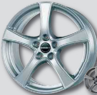
Borbet F2 silber lackiert

5,5 x 14 6,5 x 17 6,0 x 16 7,5 x 18 6,0 x 17 7,5 x 19