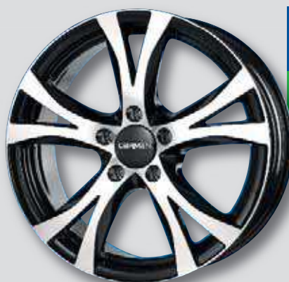
Carmani 9 Compete schwarz Front poliert

6,5 x 15 7,5 x 17 6,5 x 16 8,0 x 17 7,0 x 16 8,0 x 18