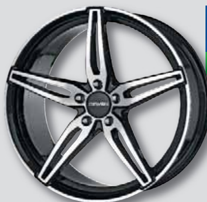
Carmani 15 Oskar schwarz Front poliert

6,5 x 16 8,5 x 18 7,0 x 17 8,5 x 19 7,5 x 18 9,0 x 20