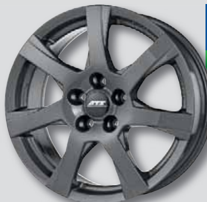
ATS Twister anthrazit lackiert

6,0 x 15 7,5 x 16 6,5 x 15 7,5 x 17 6,5 x 16 8,0 x 18