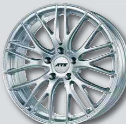
ATS Perfektion silber lackiert