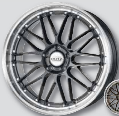
Dotz Revvo dark anthrazit Horn poliert

7,5 x 17 8,5 x 19 8,0 x 18 9,5 x 19 8,0 x 19 8,5 x 20 9,5 x 20