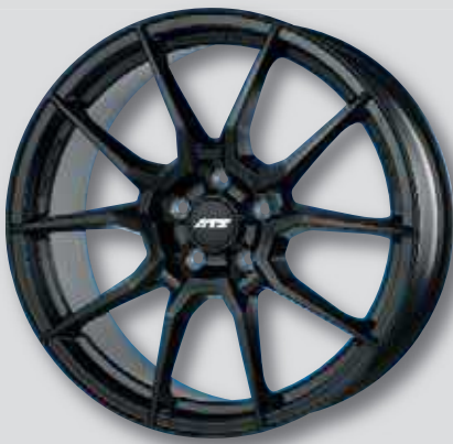
ATS Racelight schwarz matt lackiert

8,5 x 19 8,5 x 20 10,0 x 19 10,0 x 20 11,0 x 19 11,0 x 20