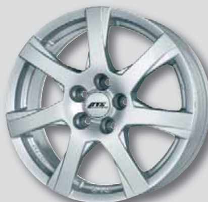
ATS Twister silber lackiert

6,0 x 15 7,5 x 16 6,5 x 15 7,5 x 17 6,5 x 16 8,0 x 18