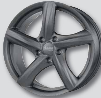
Advanti Nepa dark anthrazit matt lackiert