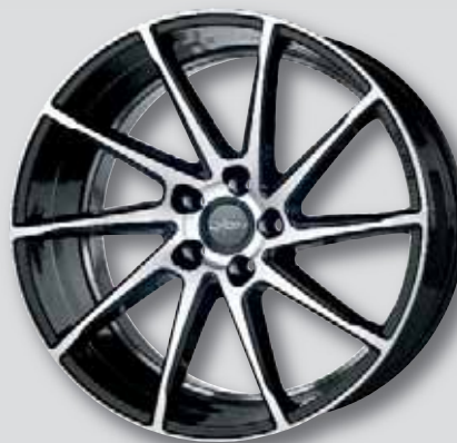
Oxigin 20 Attraction schwarz Front poliert

Weitere Farb- und Folienvarianten auf Anfrage möglich!