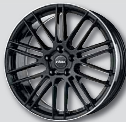
Rial Kibo / Kibo X schwarz Horn poliert

7,5 x 17 8,5 x 20 8,0 x 18 9,0 x 20 8,0 x 19 9,5 x 21