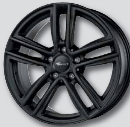
RC 27 schwarz matt lackiert

6,0 x 15 7,0 x 18 6,5 x 16 8,0 x 18 7,0 x 17 7,0 x 19 7,5 x 17 8,0 x 19