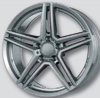
Rial M10 / M10X metal-grey