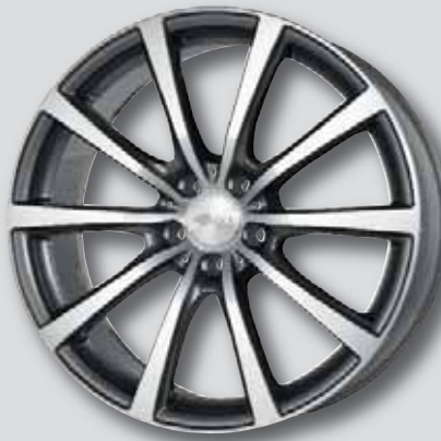
Brock B32 anthrazit Front poliert

7,5 x 18 8,5 x 20 8,5 x 18 9,5 x 20 7,5 x 19 10,5 x 20 8,5 x 19 11,0 x 20 9,5 x 19 9,0 x 21 11,0 x 19 10,0 x 22 11,0 x 22