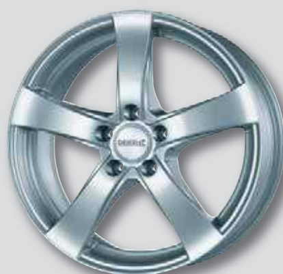
Dezent RE silber lackiert