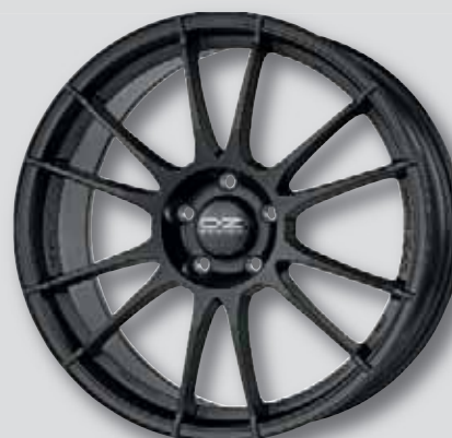
O.Z. Ultraleggera schwarz matt lackiert