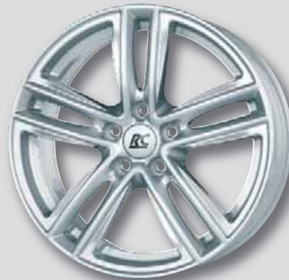
RC 27 silber lackiert

6,0 x 15 7,0 x 18 6,5 x 16 8,0 x 18 6,5 x 17 7,0 x 19 7,0 x 17 8,0 x 19 7,5 x 17