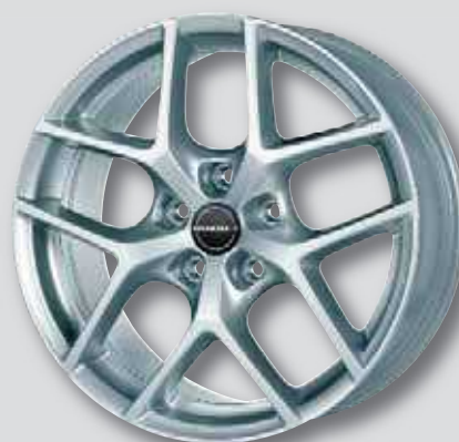
Borbet Y silber lackiert

7,0 x 16 8,0 x 19 7,5 x 17 9,0 x 19 8,0 x 18