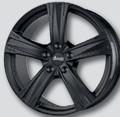
Advanti Raccoon matt black schwarz matt lackiert

7,5 x 17 9,0 x 20 8,0 x 18 9,0 x 21 8,5 x 19 10,0 x 21