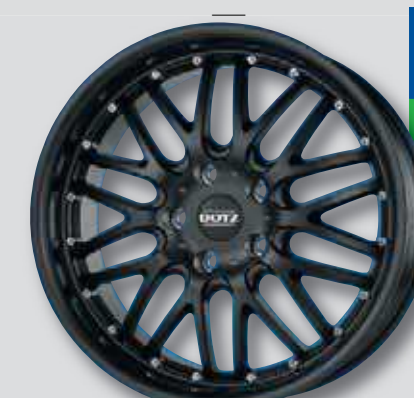
Dotz Mugello dark schwarz matt lackiert