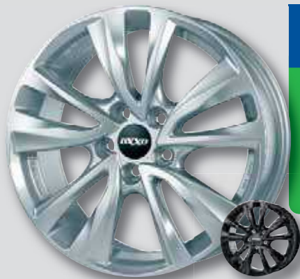
OXXO Oberon silber lackiert

4,5 x 14 * 6,5 x 15 * 5,5 x 14 * 6,0 x 16 * 4,5 x 15 * 6,5 x 16 5,5 x 15 * 7,0 x 16 6,0 x 15 * 7,0 x 17 7,5 x 17