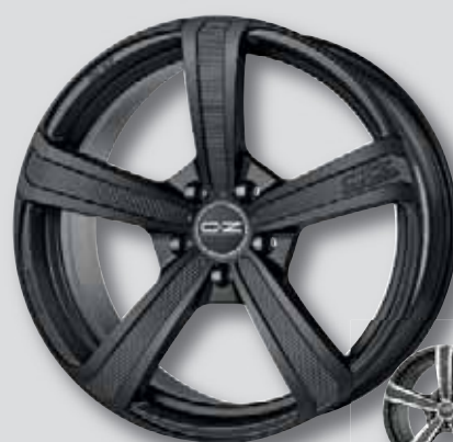
O.Z. Montecarlo HLT schwarz matt lackiert

wintertauglich * teilweise auch in crystal titanium, anthrazit matt lackiert, bronze matt lackiert, race gold lackiert