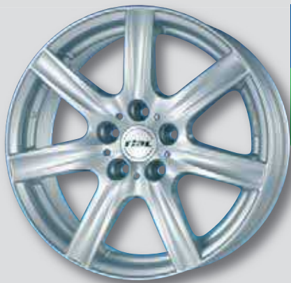
Rial Davos silber lackiert

6,5 x 16 8,0 x 18 6,5 x 17 8,0 x 19 7,5 x 17 8,0 x 20