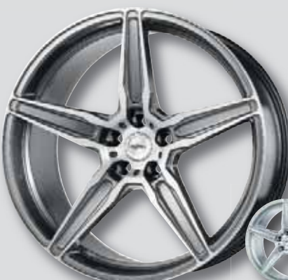
Oxigin 21 Oxflow titan brush

wintertauglich ❄️ auch mit Klebefolienveredelung