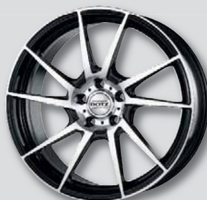
Dotz Kendo schwarz Front poliert