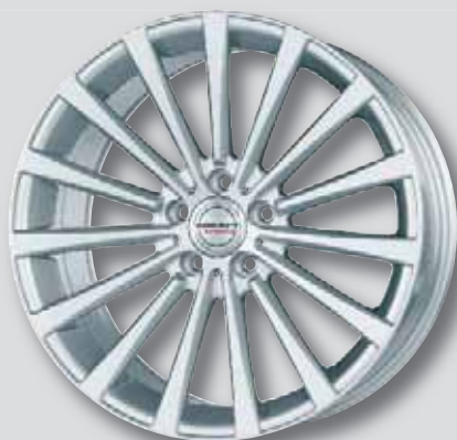
Borbet BLX silber lackiert

teilweise auch in reflectic und rot Front poliert