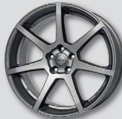
Alutec Pearl carbon grau