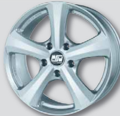
MSW 19 silber lackiert

6,0 x 14 7,5 x 16 6,5 x 15 7,0 x 17 6,5 x 16 8,0 x 17 7,0 x 16 8,0 x 18