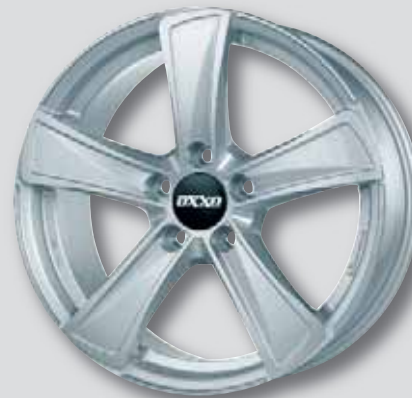
OXXO Kallisto silber lackiert

6,0 x 15 6,5 x 17 6,5 x 16 7,0 x 17 7,0 x 16 7,5 x 17 7,5 x 16 8,0 x 18 6,0 x 17 8,5 x 19