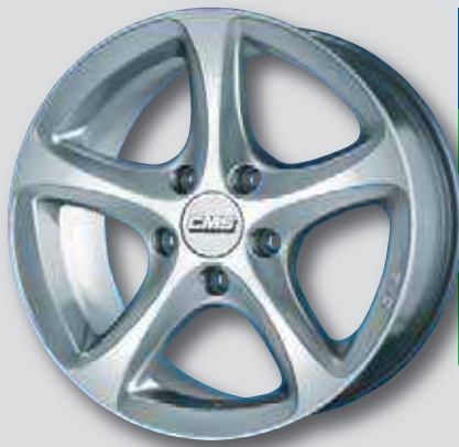
CMS C12 silber lackiert