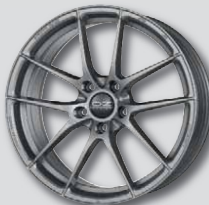
O.Z. Leggera HLT anthrazit lackiert

wintertauglich * auch in silber lackiert und schwarz matt lackiert