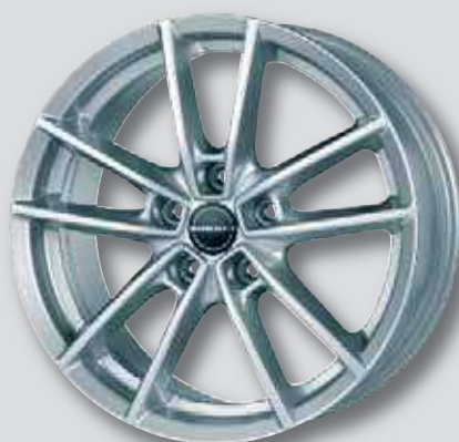
Borbet W silber lackiert