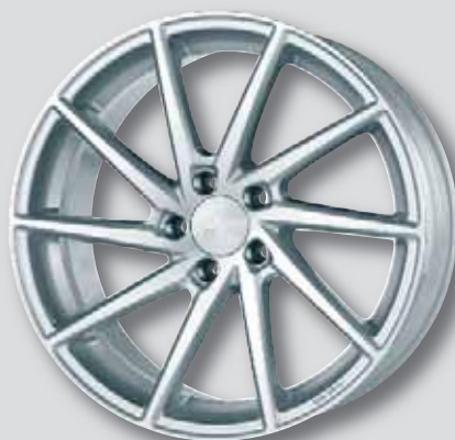
Brock B37 silber Front poliert