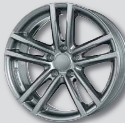
Rial X10 / X10X metal-grey