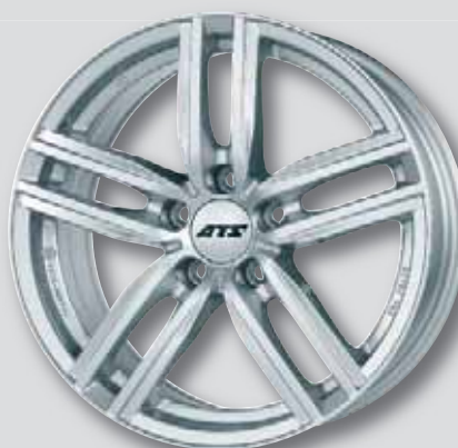
ATS Antares silber lackiert

6,0 x 15 7,0 x 17 6,5 x 16 7,5 x 17 7,0 x 16 8,0 x 18 7,5 x 16