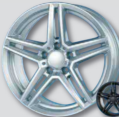
Rial M10 / M10X silber lackiert