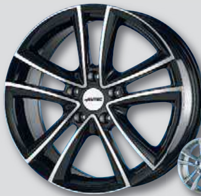
Autec Yucon schwarz Front poliert