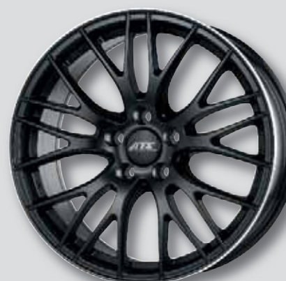
ATS Perfektion schw. matt Horn poliert

8,0 x 17 8,5 x 19 8,0 x 18 9,0 x 19 8,0 x 19 9,5 x 19 9,0 x 20