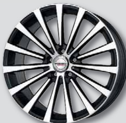
Borbet BLX schw. matt Front poliert

8,5 x 18 8,5 x 20 8,5 x 19 10,0 x 20 9,5 x 19