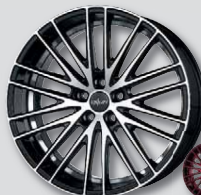
Oxigin 19 Oxspoke schwarz Front poliert