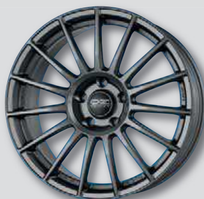
O.Z. Superturismo LM Superturismo Dakar anthrazit matt lackiert