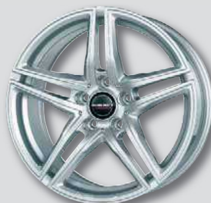
Borbet XRT silber lackiert

8,0 x 17 8,5 x 19 8,0 x 18 9,5 x 19 9,0 x 18 8,5 x 20 9,5 x 20