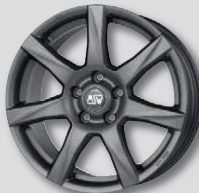
MSW 77 anthrazit matt lackiert

5,0 x 14 7,5 x 17 6,0 x 15 8,0 x 18 7,0 x 16