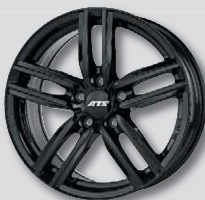
ATS Antares schwarz lackiert

6,0 x 15 7,0 x 17 6,5 x 16 7,5 x 17 7,0 x 16 8,0 x 18 7,5 x 16