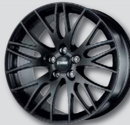
CMS C8 schwarz matt lackiert