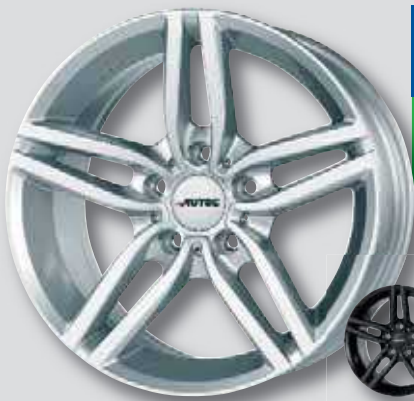
Autec Kitano silber lackiert