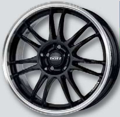
Dotz Shift schwarz Horn poliert

6,5 x 15 8,0 x 18 7,0 x 16 8,0 x 19 7,0 x 17