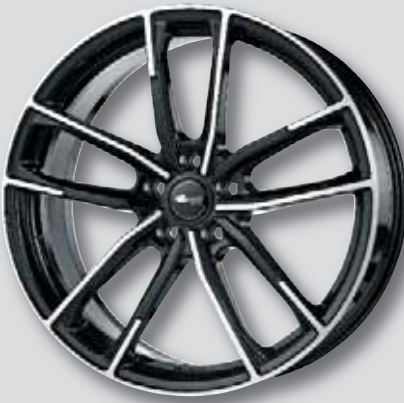
Brock B38 schwarz Front poliert