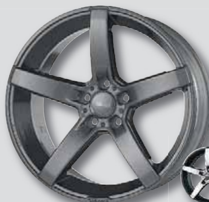
Brock B35 anthrazit lackiert