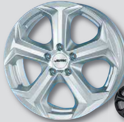
Autec Xenos silber lackiert