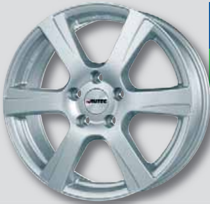
Autec Polaric silber lackiert