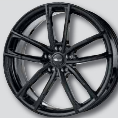
Brock B38 schwarz lackiert