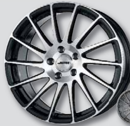
Autec Oktano schwarz Front poliert