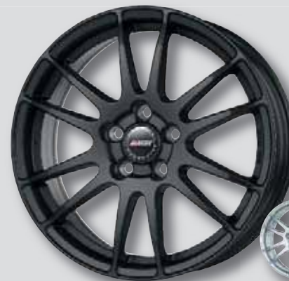
Alutec Monstr schwarz matt lackiert

6,0 x 15 7,0 x 17 6,0 x 16 7,5 x 17 7,0 x 16 8,0 x 18