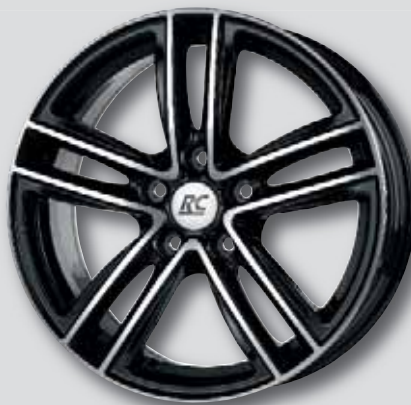
RC 27 schwarz Front poliert

6,0 x 15 7,0 x 18 6,5 x 16 8,0 x 18 7,0 x 17 7,0 x 19 7,5 x 17 8,0 x 19