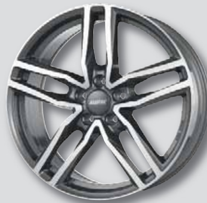
Alutec Ikenu anthrazit Front poliert

6,5 x 16 8,0 x 18 6,5 x 17 8,0 x 19 7,5 x 17 8,5 x 20