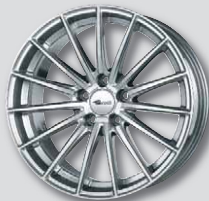
Brock B36 High gloss