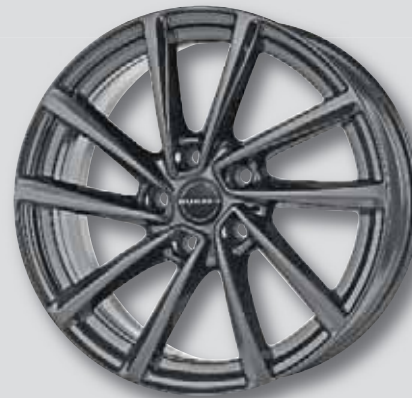
Borbet V / VT mistral anthracite