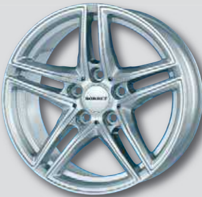
Borbet XR silber lackiert

6,5 x 16 7,5 x 17 7,0 x 16 8,0 x 17 7,5 x 16 8,0 x 18