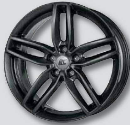
RC 29 dark sparkle