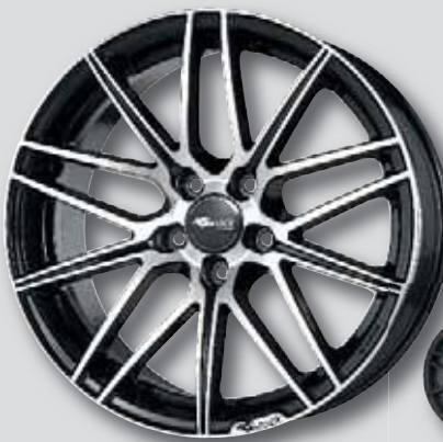
Brock B34 schwarz Front poliert