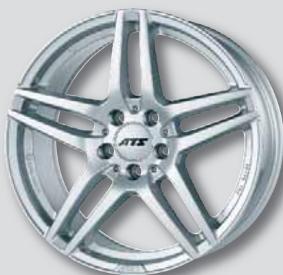
ATS Mizar silber lackiert

6,5 x 16 8,5 x 18 7,5 x 16 8,0 x 19 7,0 x 17 8,5 x 19 7,5 x 17 8,5 x 20 8,0 x 17 9,0 x 21 8,0 x 18 10,0 x 21