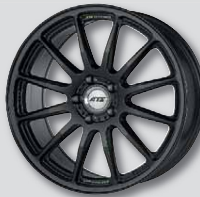
ATS Grid schwarz teilpoliert

wintertauglich ❄️ auch in silber lackiert Flowforming