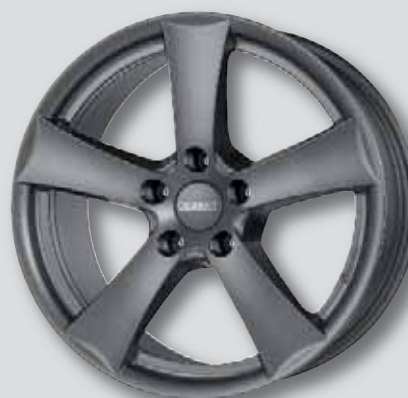
Dezent TX graphite anthrazit matt lackiert