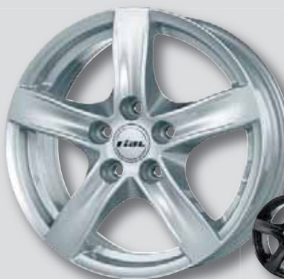
Rial Arktis silber lackiert