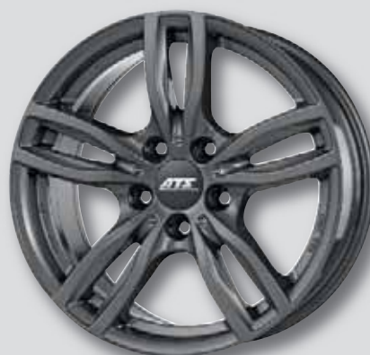
ATS Evolution anthrazit lackiert

7,0 x 16 7,0 x 18 7,5 x 17 8,0 x 18 8,0 x 17 9,0 x 19