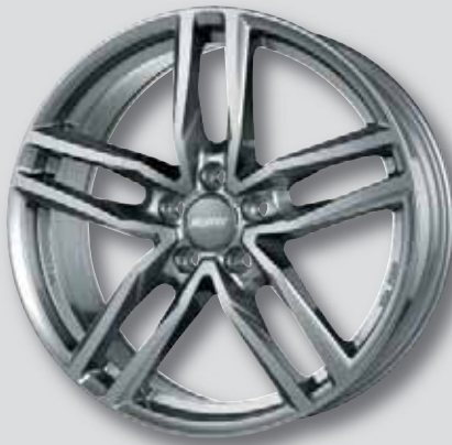
Alutec Ikenu metal-grey

6,5 x 16 8,0 x 18 6,5 x 17 8,0 x 19 7,5 x 17 8,5 x 20