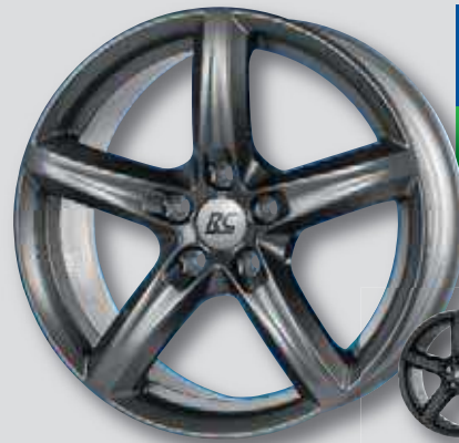
RC 24 anthrazit lackiert