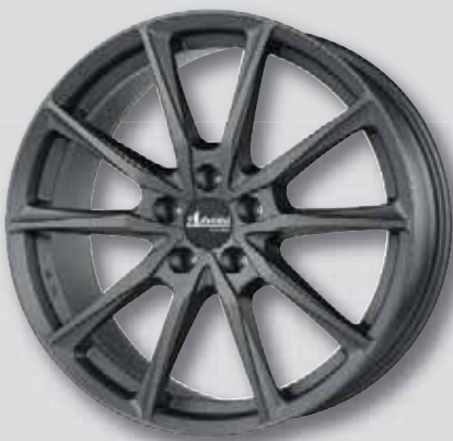
Advanti Centurio dark anthrazit matt lackiert