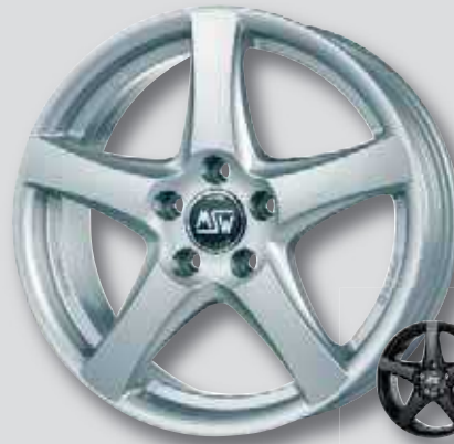
MSW 78 silber lackiert

7,5 x 17 8,5 x 19 8,0 x 18 9,5 x 19 8,0 x 19 8,5 x 20 9,5 x 20