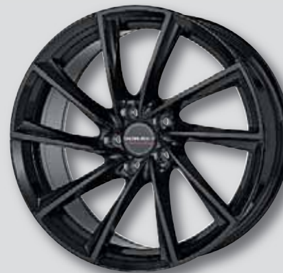
Borbet VTX schwarz lackiert

wintertauglich ❄️ auch in anthr. Front poliert