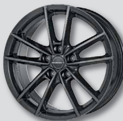
Borbet W mistral anthracite