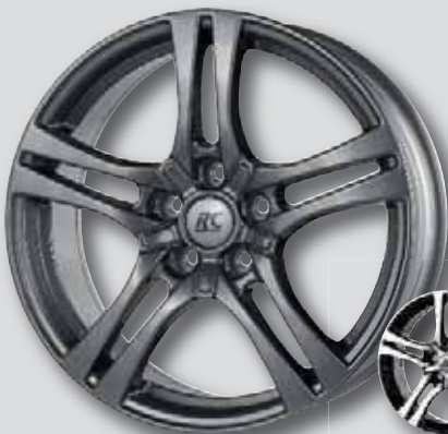
RC 26 anthrazit lackiert