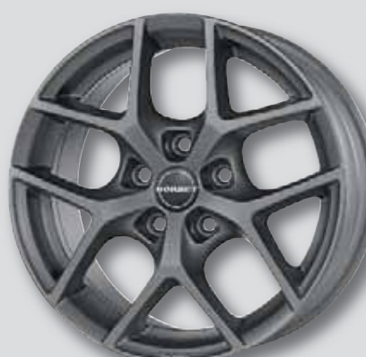
Borbet Y anthrazit matt lackiert

7,0 x 16 8,0 x 19 7,5 x 17 9,0 x 19 8,0 x 18 8,5 x 20* 9,5 x 20*