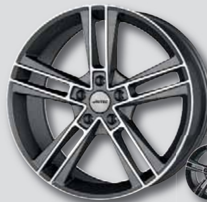
Autec Rias anthr. matt Front poliert