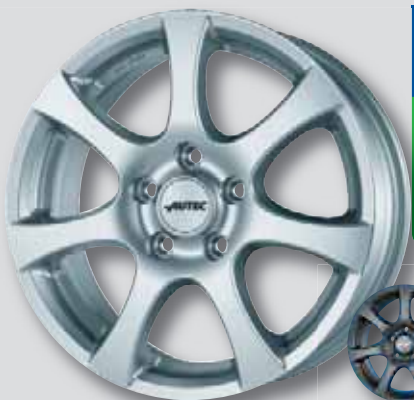
Autec Zenit silber lackiert