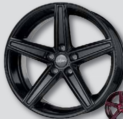
Oxigin 18 Concave schwarz lackiert