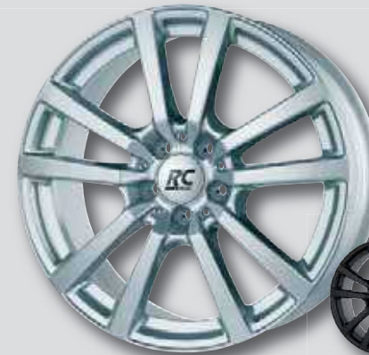
RC 25 silber lackiert

wintertauglich ❄️ auch in schwarz Front poliert