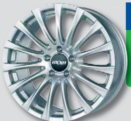
OXXO Elan silber lackiert

6,5 x 16 7,5 x 18 7,0 x 16 8,0 x 18 6,5 x 17 8,5 x 18 7,0 x 17 8,0 x 19 7,5 x 17