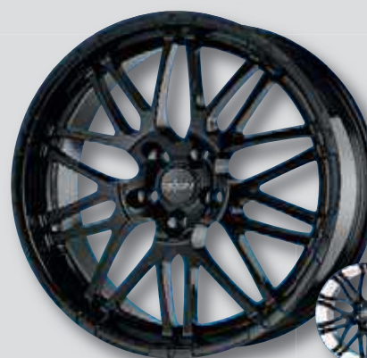
Oxigin 14 Oxrock schwarz lackiert

Weitere Farbvarianten auf Anfrage möglich!