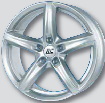
RC 24 silber lackiert