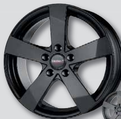
Dezent TD dark schwarz matt lackiert