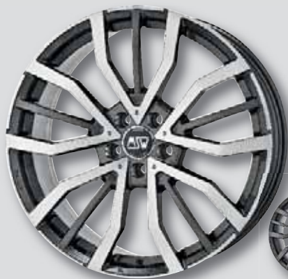
MSW 49 anthrazit Front poliert

6,5 x 16 8,5 x 20 7,5 x 17 9,5 x 20 8,0 x 18 9,0 x 21 8,0 x 19 9,5 x 21 9,0 x 19 10,0 x 21 6,5 x 20 11,5 x 21