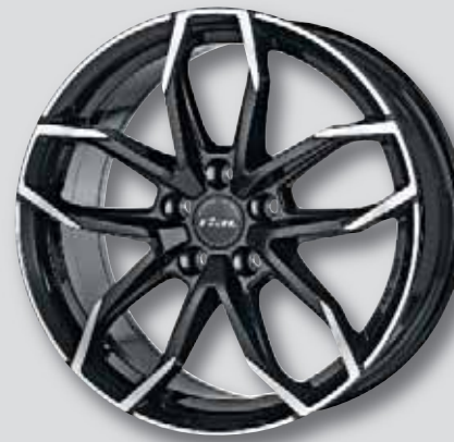
Rial Lucca schwarz Front poliert

6,5 x 16 8,0 x 18 6,5 x 17 8,0 x 19 7,5 x 17 8,0 x 20