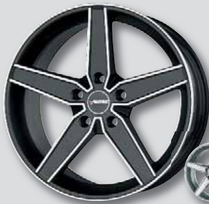
Autec Delano schw. matt Front poliert