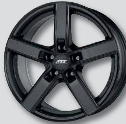
ATS Emotion schwarz matt lackiert