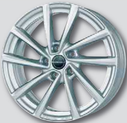
Borbet V / VT silber lackiert