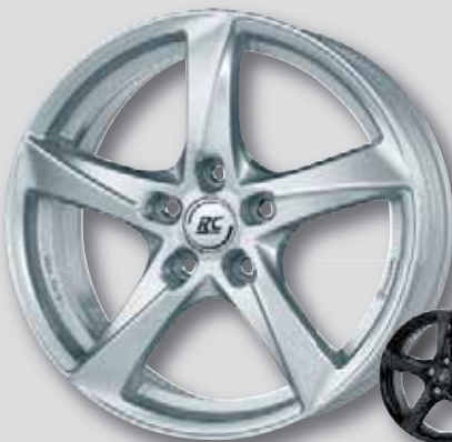
RC 30 silber lackiert

5,0 x 14 6,5 x 16 6,0 x 15 7,0 x 16 6,0 x 16 7,0 x 17 7,5 x 18