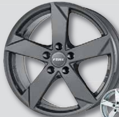
Rial Kodiak anthrazit lackiert