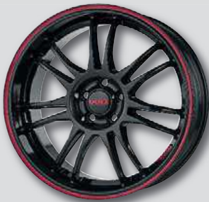
Dotz Shift Pinstripe red schwarz glanz mit rot lackiertem pinstripe

6,5 x 15 8,0 x 18 7,0 x 16 8,0 x 19 7,0 x 17